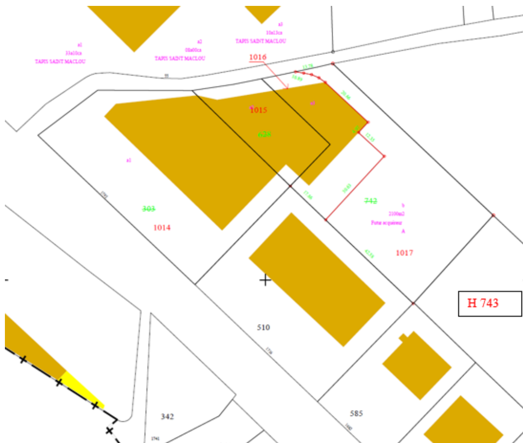
Bornage de la parcelle H 1017

En 2019, la Commune de Limonest s'est rendue propriétaire de la parcelle H 1017 (issue de la parcelle H74, propriété du Groupe tapis Saint Maclou) d'une contenance totale de 2 100m 2 , comme l'illustre le plan de bornage ci-dessous :